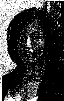
DANIELA MELCHIORRE Sottosegretario alla Giustizia